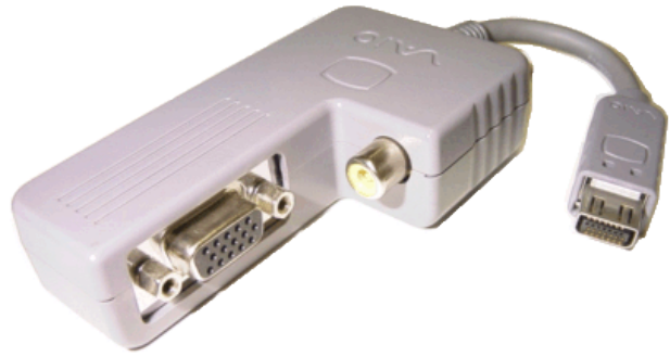
写真 2 ディスプレイアダプタの例