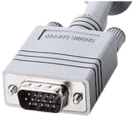
写真 1 3 段 15 ピンディスプレイ ケーブルの例