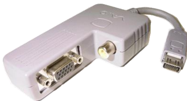
写真2 ディ스플레이アダプタの例