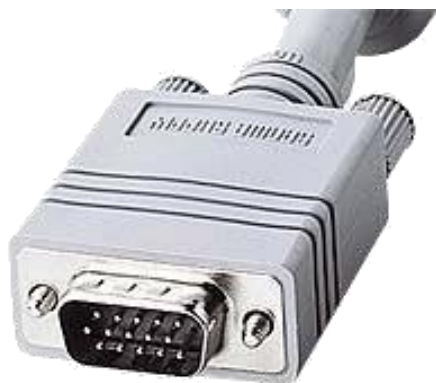
写真1 3段15ピンディスプレイケーブルの例

※会場では、プロジェクタおよび接続ケーブル（3段15ピンディスプレイケーブル、写真1）をご用意いたしますので、接続可能な状態でノートパソコンをご持参ください。小型ノートパソコンなどでディスプレイアダプタ（写真2）が必要な場合は、各自で忘れずにご用意くださいますようお願いいたします。